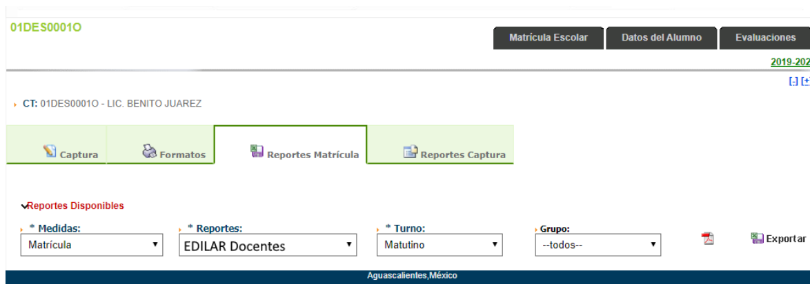
Figura 1. Sección Reportes Matrícula

Los reportes se obtendrán ingresando al módulo de Control Escolar, pestaña de Evaluacines, sección “Reportes Matrícula” (Figura 1).